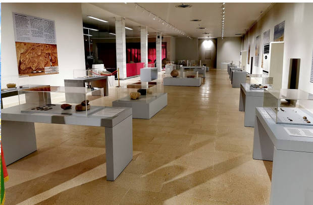
蘇萊曼尼亞博物館