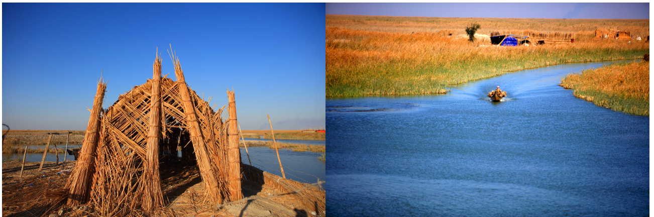
底格里斯河沼澤地區*的蘆葦屋

前往參觀薩達姆侯賽因以前的總統官邸，現在變成巴士拉博物館 Basra Museum 及鄂圖曼時代的大屋。前往底格里斯河流域，乘坐小船遊覽附近的沼澤地區，中途參觀伊拉克南部特有的蘆葦屋Mudhif House。該處早在五千年前已有人居住，是伊拉克民族文化發源地。當地的土著稱為馬坦人，以捕魚、飼養水牛及編織蘆葦為生，今天仍保留著傳統的生活方式。沿途參觀底格里斯河和幼發拉底河的交匯處Al-Qurna，阿當之樹(生命樹)。中午在傳統的蘆葦屋午飯，品嚐底格里斯河游水鮮魚。下午驅車前往納西里耶，全程 89 公里，黃昏前抵達納西里耶。暢遊市中心幾條商業大街及市集，選購各種手信及紀念品。