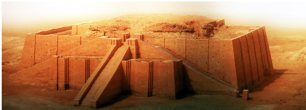
吾珥王朝塔廟遺址*

離開烏魯克 143 公里，前往什葉派聖城庫法(建於公元 622 年，伊斯蘭教曆元年，與馬什哈德、卡巴拉和納傑夫合稱什葉派四大重鎮，伊斯蘭教最後一位正統哈里發阿里在位時期將其定為都城。)，參觀庫法大清真寺，及第一代伊瑪目阿里的故居。黃昏時份抵達安葬什葉派第一代伊瑪目阿里的聖城納傑夫，參觀建於 977 年的阿里聖祠，聖祠規模宏大，以金黃色作為大門主色，令人留下深刻印象。