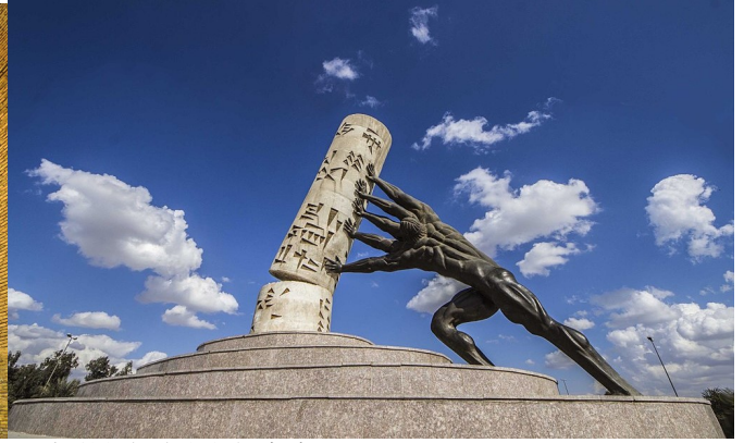
拯救伊拉克文化紀念碑